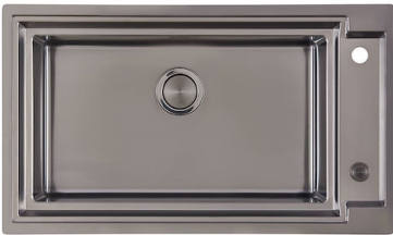
OUTLINE GUN METAL